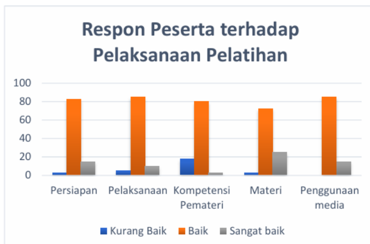
Gambar 2. Respon Peserta Terhadap Pelatihan

Selanjutnya, agar penilaian berlangsung dari peserta dan penyelenggara, maka evaluasi kegiatan dilakukan oleh tim PKM untuk mengukur tingkat penguasaan materi, kemampuan praktik dan produk peserta dari kegiatan pelatihan. Adapun komponen yang dilakukan penilaian antara lain: 1) pemahaman tentang materi aplikasi Articulate Storyline; 2) kemampuan menggunakan aplikasi Articulate Storyline ; 3) kemampuan membuat materi ajar melalui aplikasi Articulate Storyline; 4) kemampuan melakukan finishing ; 5) Pemahaman tentang media pembelajaran.