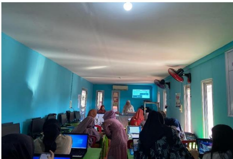
Gambar. 1. Praktik Pembuatan materi ajar berbasis Articulate Storyline

Kegiatan pelatihan ini dilakukan penyampaian materi dan praktek secara merinci sebagai berikut :