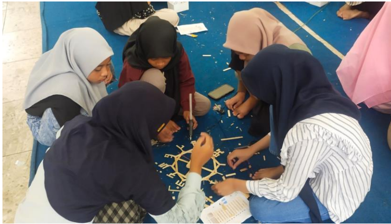
Gambar 2. Workshop pembuatan handycraft berbahan daur ulang

TBM tidak hanya berfungsi sebagai tempat membaca, tetapi juga bisa dimanfaatkan secara maksimal sebagai sarana belajar yang mendukung program pemberdayaan masyarakat (Fatihin, Sucipto, et al., 2025; Ishom et al., 2021). Sasaran program TBM Rumah Inspiratif tidak hanya anak-anak, melainkan juga pemuda dan orangtua. Kegiatan ini dikolaborasikan agar seluruh elemen masyarakat dapat mendapatkan manfaat dari kehadiran TBM. Pengelolaan program handycraft di TBM Rumah Inspiratif tidak hanya dilakukan di Basecamp TBM, tetapi juga dilakukan di beberapa desa yang lokasinya agak berjauhan. Hal ini terjadi karena keaktifan para volunteer di rumah inspiratif untuk mencari mitra kerjasama. Jangkauan kegiatan Rumah Inspiratif dapat mencapai seluruh desa di Kabupaten Jombang.