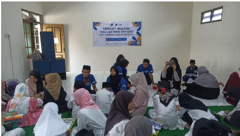
Gambar 1. Capacity Building Bagi Pengelola Rumah Inspiratif

Gambar 1 menunjukkan bahwa kegiatan capacity building juga dilakukan dalam rangka penguatan kapasitas pengelola dan relawan untuk memberikan tambahan pengetahuan terutama dalam proses fasilitasi forum belajar masyarakat. Tanpa peningkatan kapasitas yang terencana dan berkelanjutan, TBM akan sulit menjawab tantangan zaman, terutama dalam menghadapi rendahnya minat baca, keterbatasan sumber daya, dan perubahan pola konsumsi informasi masyarakat di era digital. Oleh karena itu, penguatan kapasitas pengelola dan relawan bukan hanya strategi teknis, melainkan merupakan investasi strategis dalam menciptakan ekosistem literasi yang hidup, inklusif, dan berkelanjutan. Hal ini untuk mendorong pengelola TBM sebagai pusat informasi yang selalu berusaha untuk bisa memberikan pelayanan informasi yang memadai kepada masyarakat sekitarnya (Jannah & Nisa, 2023).